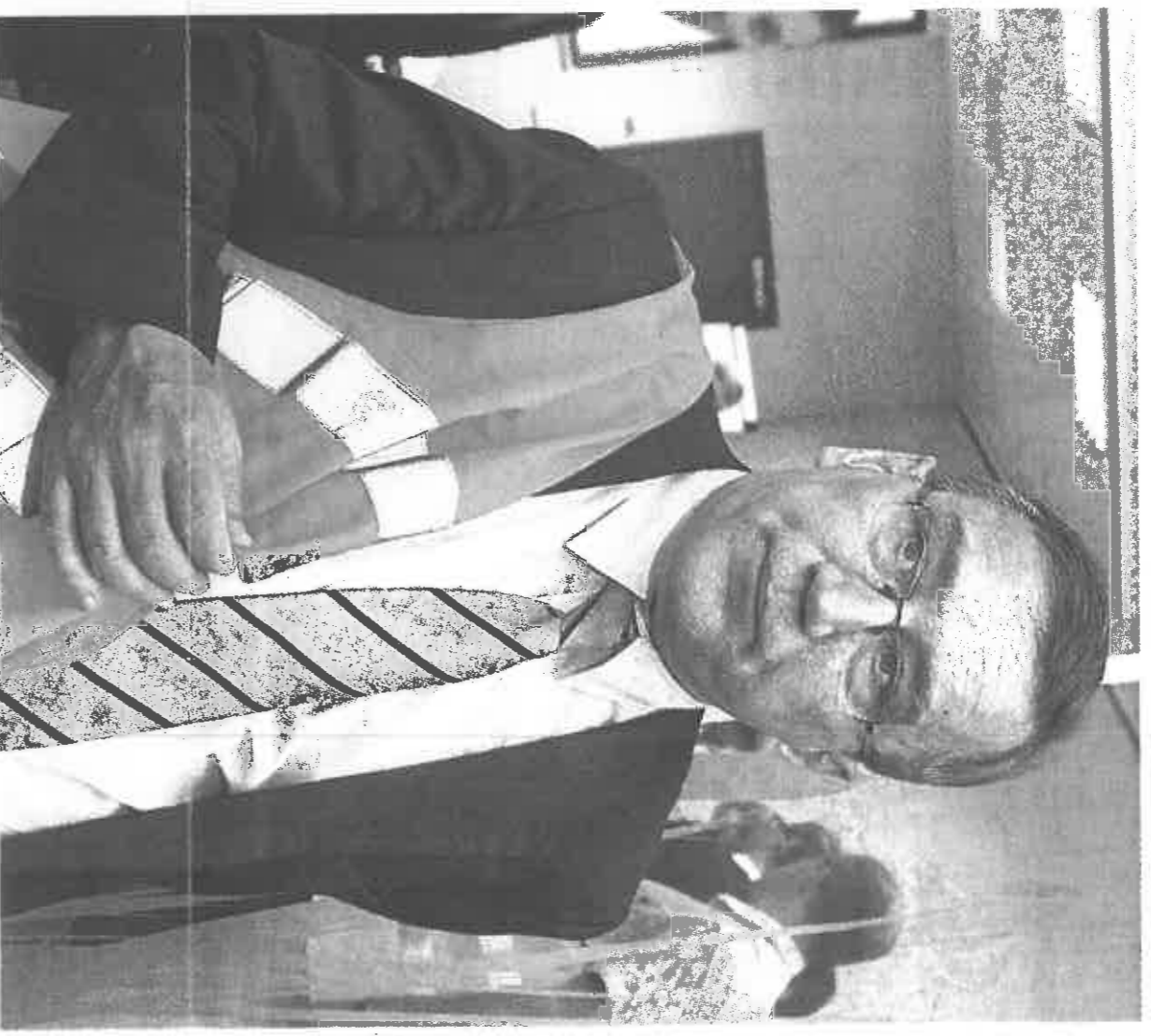
Maandus- ja kommunikatsiooniminister Juhana Partsi peab õigeks, et Tallinna-Tartu maanteed ehitatakse väikeste lõikudega edasi.

Väga tihti. Kas peate kahe rajalist teed õhtli-kuks? Muudugi seal on erinevad lõi-