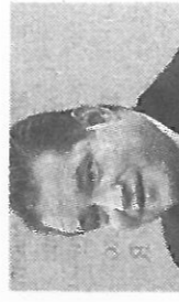
IVARI PADAR Euroopa Parlamendi saadik

Kui me paneksime korraga 50 kilomeetrit remonti, õõtsud 50 kilomeetrit remondis oleva tee peal – teise otsa jõudes oleid päris segane peast. Aga kui sa õõtsud 10 kilomeetrit, kannatab ära.